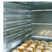
Intérieur Inox Stainless steel inside