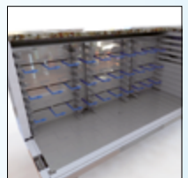
Air ventilé canalisé Sheathing ventilated air