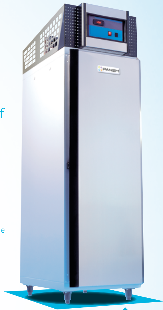
Froid ventilé / Ventilated cooled air option : chocolat Double-service / For chocolate storage Pass-through