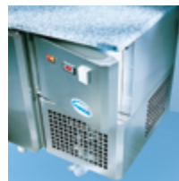
Accessibilité technique Technical easy reach