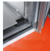
Variable configuration Agencement variable